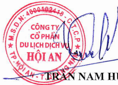
TRẦN NAM HƯNG